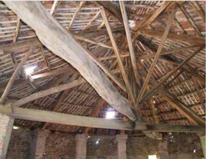
12 Copertura del piano sottotetto della torre del Leone.