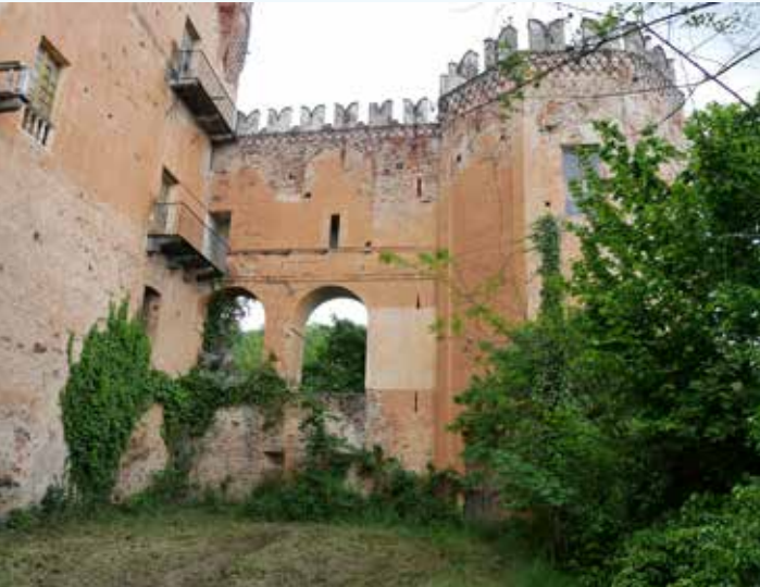
3 Prospetto est del castello con la torre di Valfrigida.