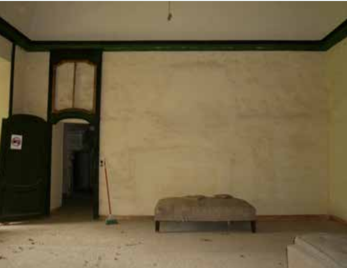
9 Lato est della camera da letto con arredo ancora presente.