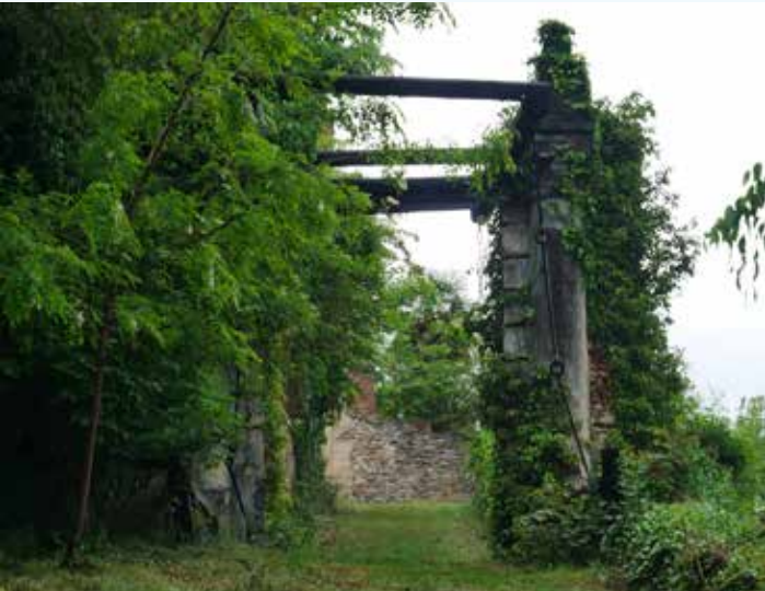
1 Ponte levatoio sul percorso di accesso al giardino superiore.