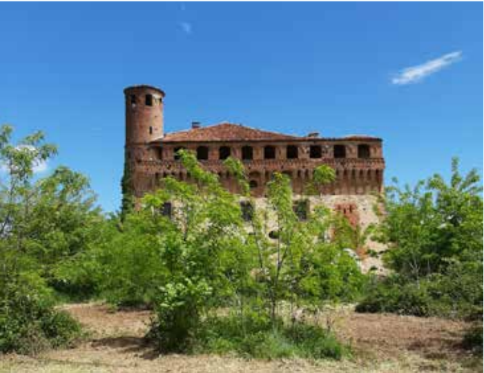
2 Prospetto ovest del castello con vegetazione infestante.