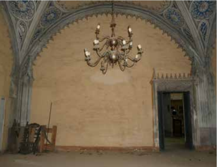
8 Lato ovest del locale affrescato con decorazioni neogotiche.