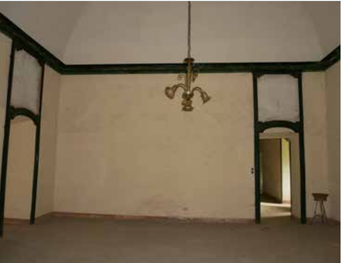
10 Lato ovest del locale nord-est del castello.