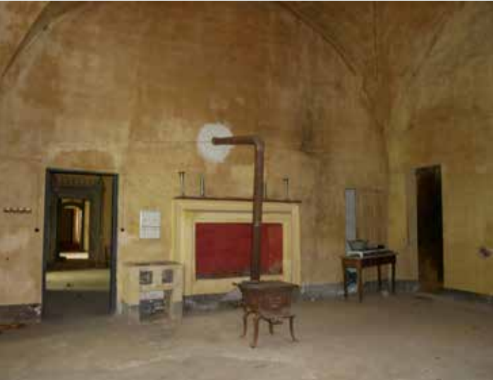
7 Lato est della cucina con arredo novecentesco.