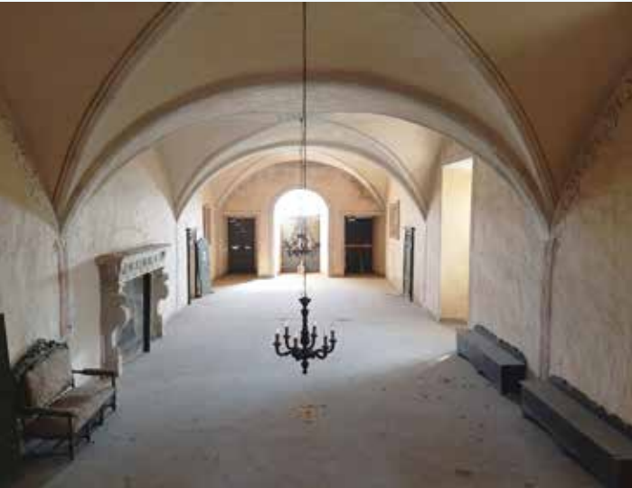
5 Vista del grande salone con l'arredo ancora presente.