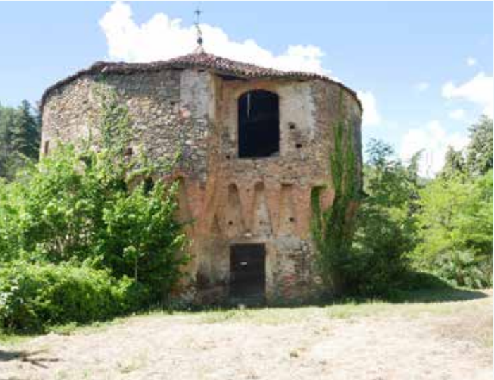
4 Prospetto est della torre del Leone.