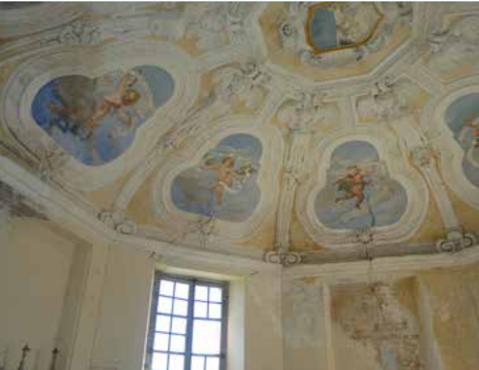
11 Volta affrescata della cappella nella torre di Valfrigida.