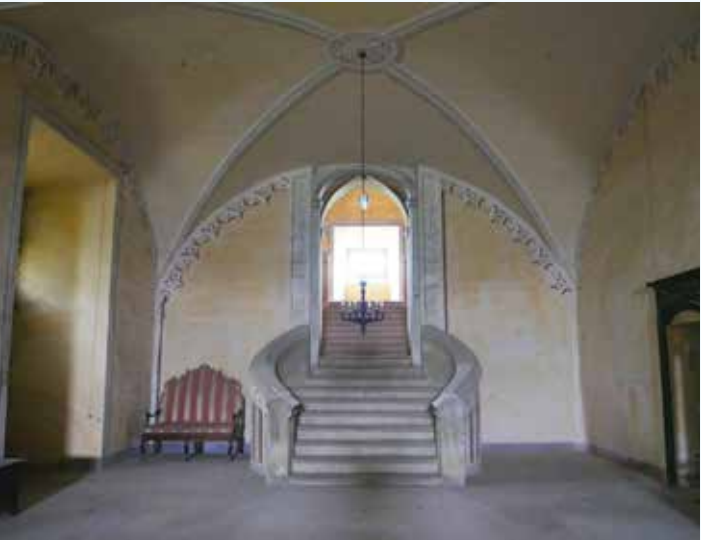
6 Accesso al vano scala dal salone al piano terra.